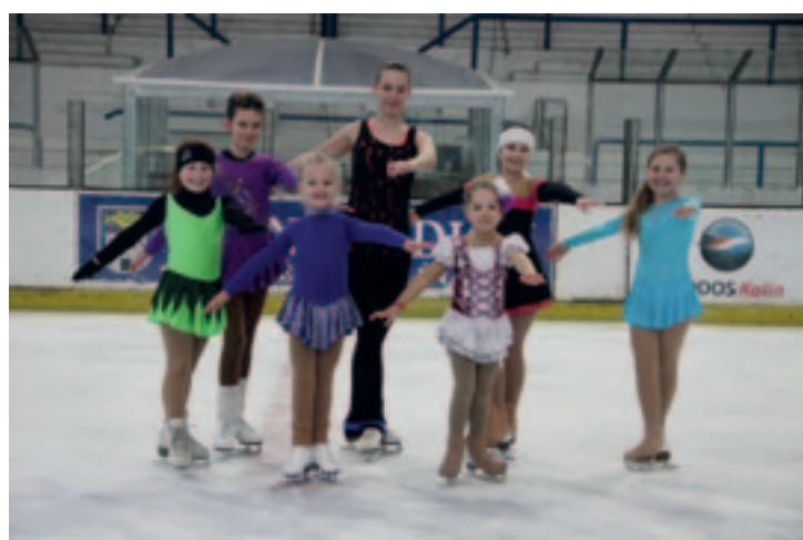
► Poděbradské krasobruslařky na kolínském ledě

I když se trénink na kolínském ledě konal pouze jednou týdně, doplnil přípravu krasobruslařek tak, že mohly startovat v soutěžích (Mladoboleslavský pohár, Nymburská stuha, Ještědská brusle) a úspěšně reprezentovat naše město. Nyní po ukončení hlavní hokejové sezony krasobruslařky trénují opět dvakrát týdně v Nymburce.