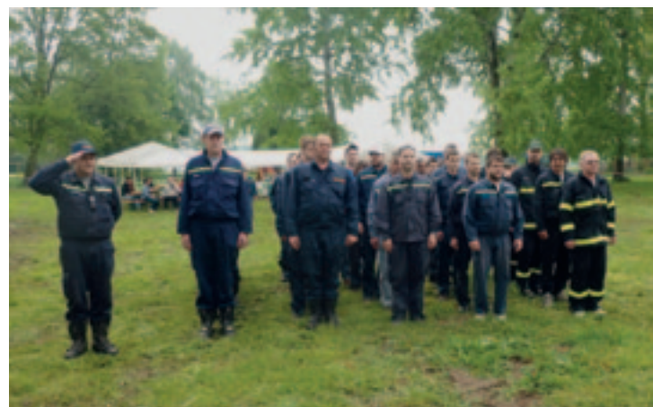
▶ Hasičské sbory při nástupu

požárních útoků mladých hasičů. V ní měly týmy za úkol shodit dvě plechovky naplněné betonem pomocí kbelíku, který napouštěly hasiči hadic. Vodu čerpal z Jezera pomocí hadic.