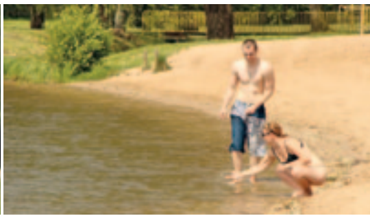
V květnu už na Jezero zavítali první „vodní nedočkavci“