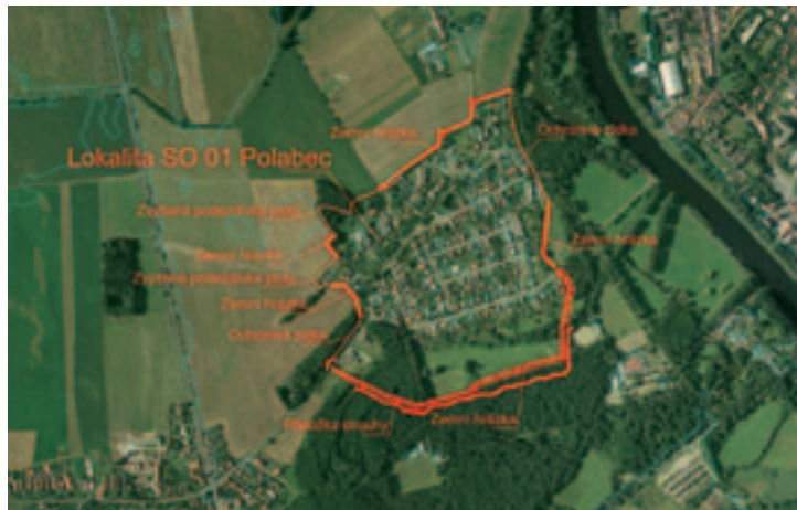
Výřez výkresu z dokumentace pro stavební povolení k akci „Labe, Poděbrady, zvýšení protipovodňové ochrany“

Původně se projekt protipovodňových opatření týkal také Velkého Zboží, Kluku a Přední Lhoty. Tento plán však zkřížila obtížná jednání s majiteli dotčených pozemků.