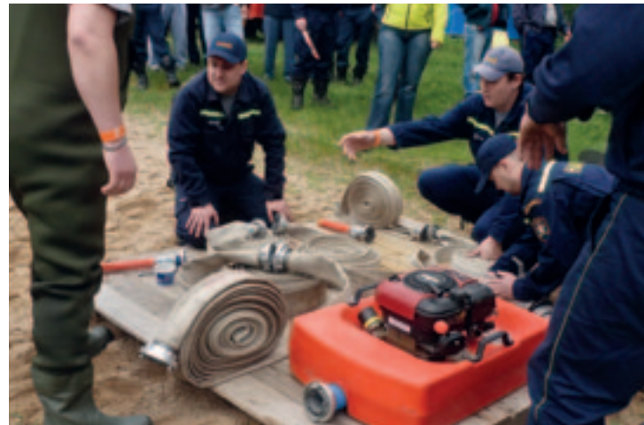
▶ Kontrola výbavy před startem soutěže

kem minulého století. Připomněl, jaká dříve používali vozidla, jak se prostory pro sbor rozšiřovaly a jak se zlepšovala výbava. Zavzpomínalo se i na zásah hasičů při povodních v roce 1981 a v roce 2006. Také byli všichni návštěvníci pozváni na Dětský den, který pořádá hasičský sbor již od roku 2007. Letos se koná 1. června 2013.