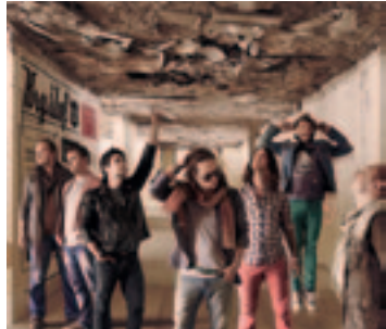
► Jednou z největších hvězd Votvíráku 2013 bude kapela Kryštof

S návštěvností festivalu jsme byli zatím vždy spokojeni, takže pokud se bude opakovat ta loňská (cca 50 000 lidí, pozn. red.) nebo se nám ji dokonce podaří zvýšit, budeme moc rádi.