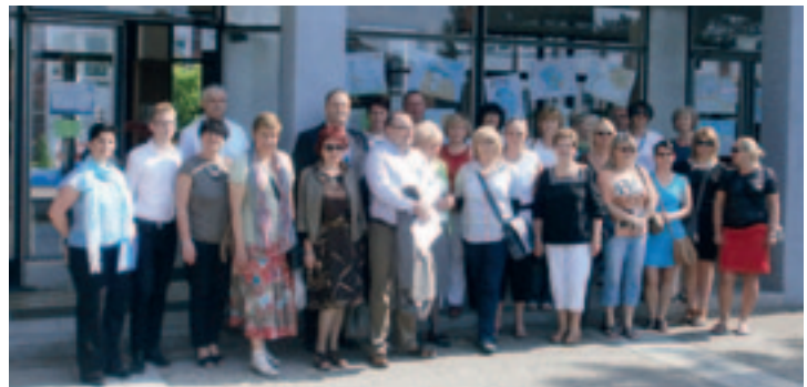
Polské návštěvě se na ZŠ Václava Havla líbilo

Polská delegace stihla ještě navštívit projektový den „Multikulturní výchova“ ve třídách 2. stupně a vyslechnout představení péče o žáky s poruchami učení. Její členové se dozvěděli o práci psychologického poradce a školního psychologa nebo prouklidli do systému výchovy k aktivnímu občanství a zjis-