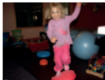
► Dětský koutek – trénink na „opičí dráze“ pro lepší rovnováhu

klientelu – děti počínaje, seniory konče. V centru je denně přítomen fyzioterapeut nebo profesionální trenér. Nabízíme speciální programy pro obězní děti a pro nejmenší se špatným držetím těla. Spolupracujeme také s Léčebnou Dr. Filipa, uvedla Větrovská. Další cvičební lekce jsou určeny pro těhotné, ženy po porodu a s dětmi. Maminky mají prostor na cvičení a pro děti je vytvořena speciální „opičí dráha“ pro stimulaci plosek nohou a srovnání špatného držetím těla. Centrum se dále specializuje na spolupráci se seniory, s lidmi s nadváhou a obezitou.