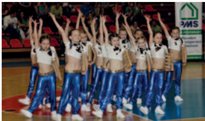
► Zlaté poděbradské kovbojky

Náš oddíl soutěž v rámci Tour nejen pořádal, ale samozřejmě jsme i zde měli svá želízka v ohni. Šest skladeb našeho oddílu si přivezlo 5 zlatých a 1 stříbrnou medaili. Dopoledne zvítězila naše