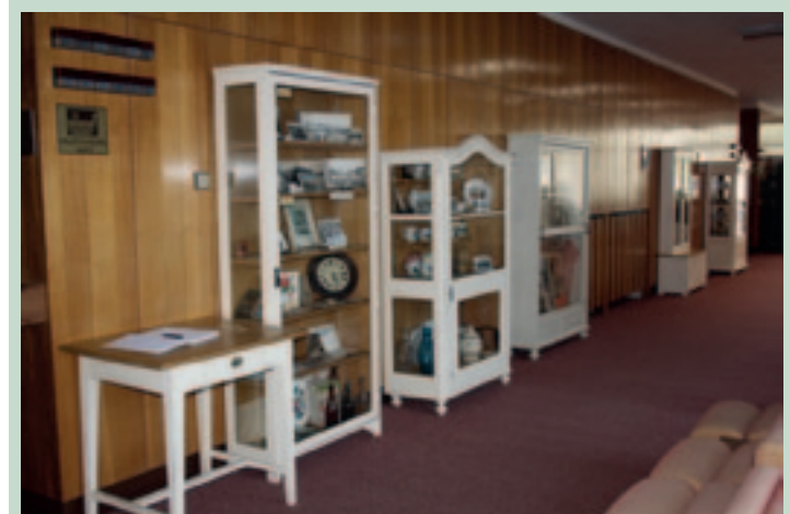
► Soukromé muzeum historie lázeňství v Poděbradech, které bylo původně umístěno ve Vinotéce U Kostela, se nově nachází v přízemí Centrálních lázní. Expozice je volně přístupná denně od 7 do 19 hodin (případně i déle)