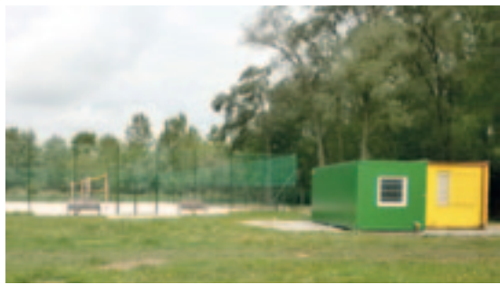
Plážovní volejbalisté mohou využívat převlékácké kabiny

V průběhu května probíhají na Jezeře poslední nutné úpravy, čistí se pláž a nejen otužilac už okouší stoupající teplotu vody. Nejen zchlazení ve vlnách Jezera bude lákat v letních vedrech návštěvníky na nejfrekventovanější poděbradské místo prázdninové relaxace.