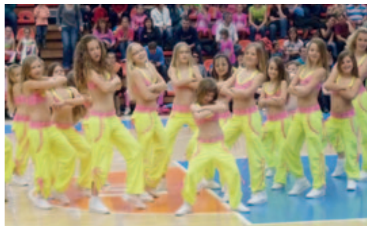
► Neon zumba v podání lázeňských dívek

Skladba Na pláži nám tentokrát přinesla bronz. Starší dívky opět při skladbě China Town nezávážaly a svým soupeřkám nedaly šanci. Potvrdily tak svou neporazitelnost a vybojovaly zlaté medaile.