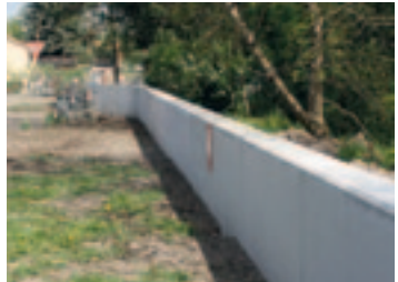
V některých částech Polabce se staví i betonové bariéry

Text: H. Peňázová, A. Kubelka