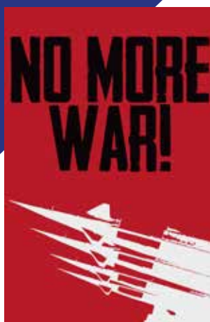
Tomáš Zedník, DNM4