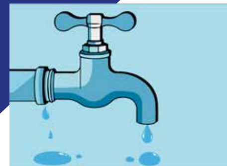
Vendula Vondráčková, DNM4