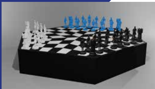
Pavčina Čerovská, MMT4